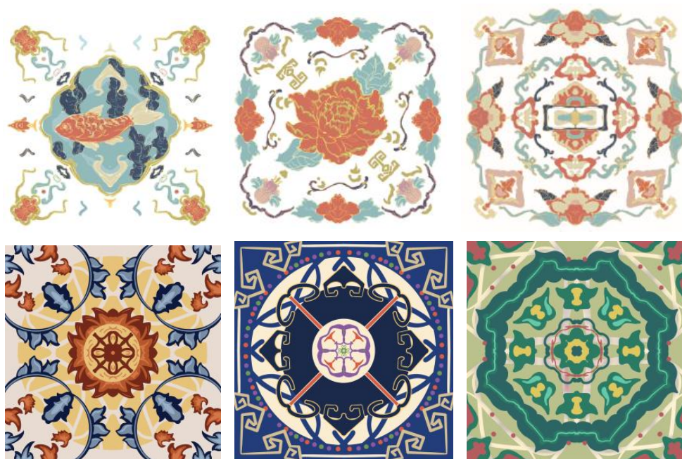
图 2 广彩纹样视觉图案再设计

如图 2，将六方形纹样的构图形式基本采用了中轴对称、放射形式和十字构图等较为常见的构图形式，在统一图形视觉中心和画面层次感的前提下，在使用时在旋转器物或者近景观看时用户可迅速捕捉到其图形结构。色彩在维持广彩传统的红绿对比和金地为主要特征的情况下，添加了低饱和度的粉绿色和蓝紫色的辅助色调，在一定程度上减少 VR 场地下长时间的色彩感受所形成的视觉疲劳性，在表现视觉感官上亦更加契合数字媒介的审美需求。