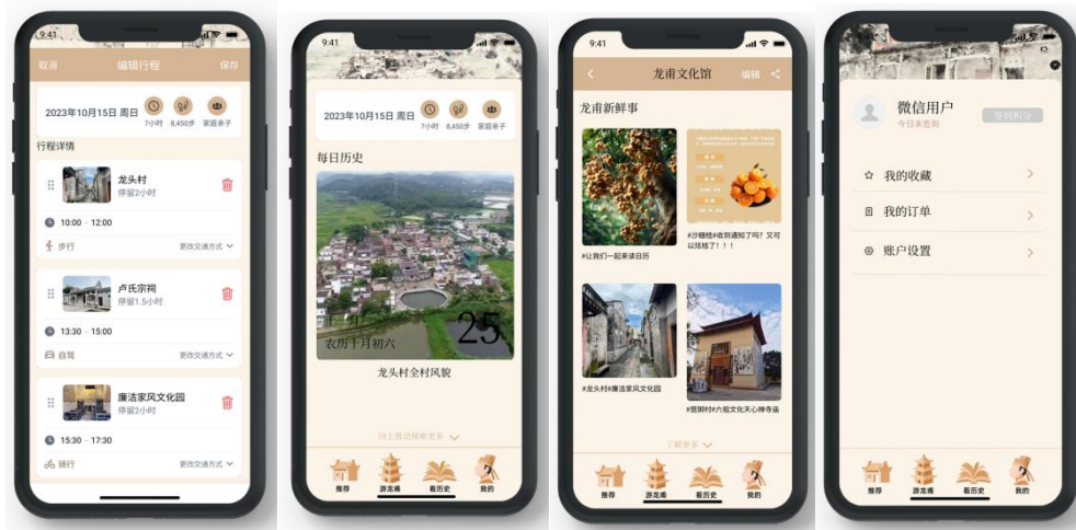
图 4 智旅龙甫 APP 设计 制作邹焯婷