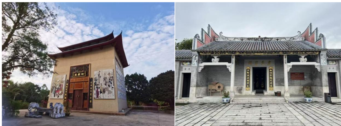
图1 龙甫镇庙宇调研

四会龙甫拥有得天独厚的自然资源与深厚的文化底蕴，构建了文旅融合创新的优质内容基底。在自然资源方面，龙甫镇地处丘陵与平原交汇地带，水系发达，植被丰茂，盛产砂糖桔、龙眼等特色农产品，形成了以田园风光和农业生态为核心的景观资源。同时，当地保留有传统岭南风格的村落建筑、宗祠文化及民俗节庆等人文遗产，共同构成了兼具生态价值与文化魅力的乡村旅游资源体系，为“智旅龙甫”平台的内容构建与体验设计提供了丰富素材。在文化资源方面，龙甫镇保留了较为完整的岭南传统村落格局与建筑风貌，宗祠文化底蕴深厚，民间节庆、手工艺及口述历史等非物质文化遗产丰富多样，为文旅融合提供了深层次的文化内涵与体验载体 [4] 。六祖惠能曾因避难“遇会则藏”，在龙甫镇营脚村扶卢山刻苦修炼十五载，山下建有“六祖庵”和“六祖古寺”。深入挖掘龙甫家风家训文化的精髓，建设了廉洁人物墙绘、家训长廊、宗祠展馆、清廉家风展馆等系列文化载体，龙头村拥有独特的文化魅力。拥有千年历史的廉政教育基地，集清廉家风教育、廉政文化展示、廉政文艺创作于一体。龙甫美食种类丰富，包括锅边菜、茶油鸡、地豆炭烧肉等，深受游客喜爱。这些独特的文化旅游资源，为其乡村文旅创新平台的设计提供了丰富的创意灵感 [5] 。