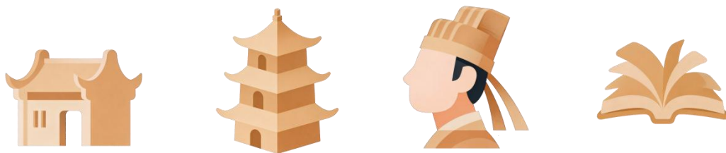
图 4 美丽乡村智旅平台 icon 设计 (制作邹烨婷)

视觉设计的起点在于对龙甫镇核心文化符号的深度挖掘与现代化转译。我们主要从建筑与自然中汲取灵感,首先纹样萃取,对龙头村特色岭南“聂耳屋”的建筑构件进行精细化分析,提取了屋脊、窗棂、墙楣上最具代表性的回形纹、冰裂纹与博古纹等装饰纹样。这些纹样历经岁月沉淀,蕴含着吉祥、雅致的文化寓意。其次,在色彩体系建构上,在主色调上采用温暖且充满活力的沙糖桔橙色。此色彩直接源于龙甫最具代表性的农产品,象征着丰收、热情与亲和力,能瞬间建立用户对龙甫的品牌联想。在辅助色上采用禅意赭石,其源于六祖庵、天心禅寺等古建筑的墙体色彩,沉稳、古朴,用于重要按钮和图标,体现深厚的历史文化底蕴。在生态绿色上代表龙甫丰茂的植被与田园风光,用于表现自然生态、农业体验等相关板块。最后在底蕴暗红上灵感来源于龙甫红色文化及宗祠的漆色,用于强调、警示或重要标题,增添界面的层次与庄重感。将聂耳屋的镗耳山墙轮廓进行抽象化和简约化处理,形成独特的品牌图形符号,应用于 App 的 Logo、页面分割线等细节处,强化地域辨识度。