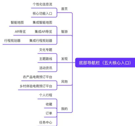
图 5 底部导航栏信息架构图