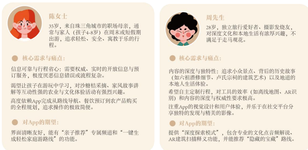
图 3 用户画像 (制作邹烨婷)